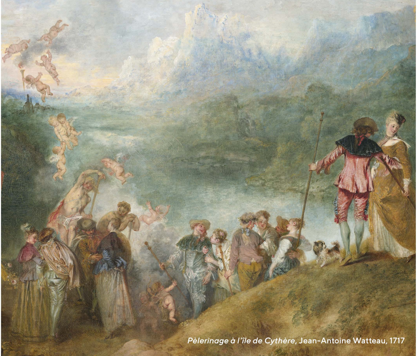
Pèlerinage à l'île de Cythère, Jean-Antoine Watteau, 1717